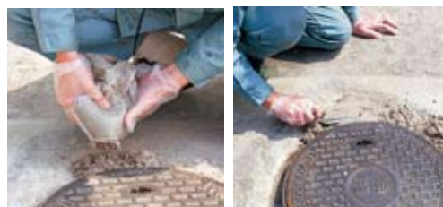
ネタ配り コテならし