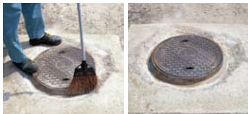
被塗面のゴミ・ホコリを除去 素地調整完了