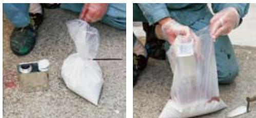
材料の準備 樹脂液の投入